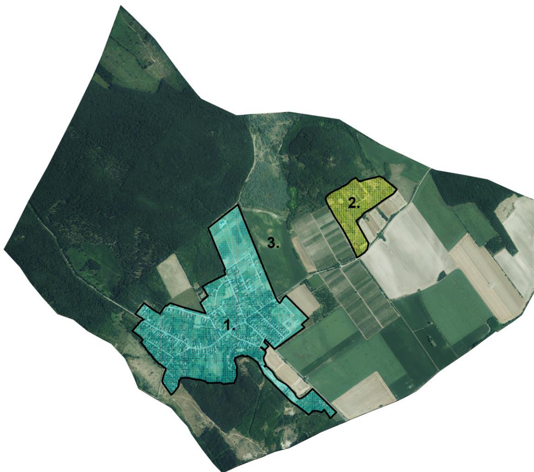
Nadap község településrészei (funkció és szerepkör alapján)

A fejlesztési célok többsége a település egész területét érinti. Ilyenek leginkább az általános célok, amelyek mindenhol érvényesítendőek, illetve a területhez ténylegesen nem köthető fejlesztések. A célok kisebb része az egyes településrészekben fejti ki leginkább hatását.